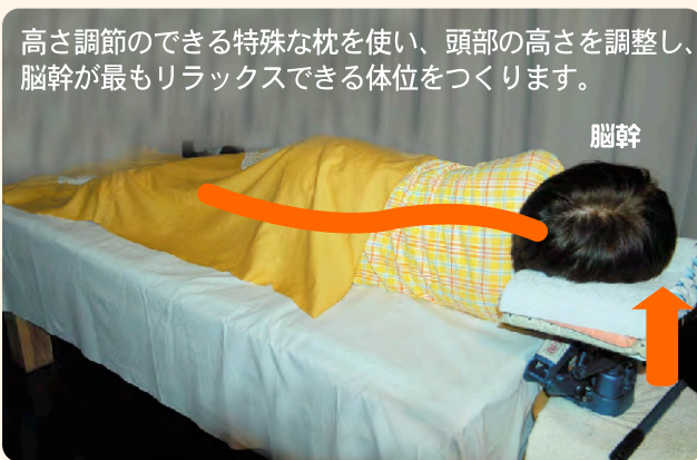
高さ調節のできる特殊な枕を使い、頭部の高さを調整し、脳幹が最もリラックスできる体位をつくります。

治療を受けられる方へ ●綿100%もしくは、絹100%のもので金属類のボタンやファスナーなど付いていないゆったりとしたパジャマ等の着替えをご用意下さい。